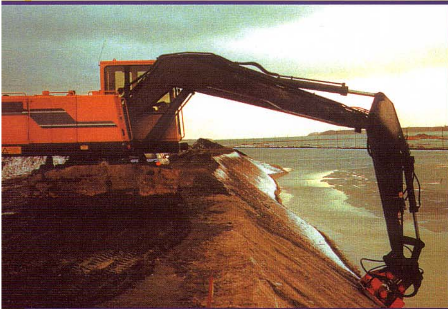
A STANTLEY tömörítőgép ideális berendezés minden tömörítési munkához. Kialakítása a legkíméletlenebb igénybevételre is alkalmassá teszi. A tömörítés hatásfoka 95%!