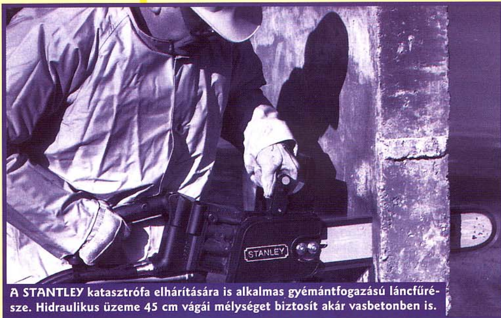
A STANLEY katasztrófa elhárítására is alkalmas gyémántfogazású láncfűrész. Hidraulikus üzeme 45 cm vágási mélységet biztosít akár vasbetonban is.

Magyarországon most megjelenő FAIRMONT gépek tovább színesítik a hidraulikus szerszámok választékát: